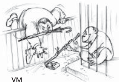
ум mind, intelligence