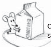
сметáна sour cream