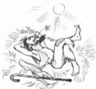
хоро́шее настроéние good mood